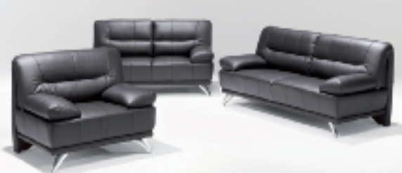
Echt Leder 3-2-1