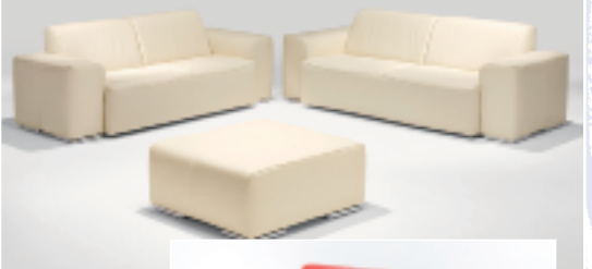
Echt Dickleder 3-2